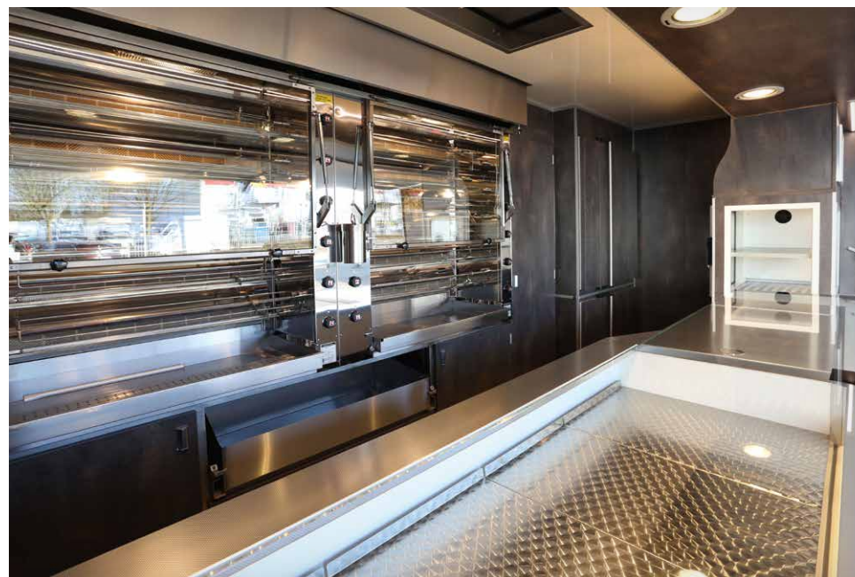
UBERT RT 66 DUO Infrarot-Hähnchengrillgerät