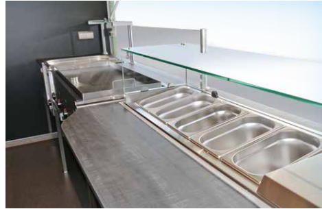
Saladette mit Spuckschutz