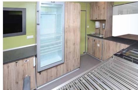
Getränkekühlschrank mit Glastür