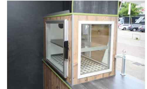
Dreiseitig verglaster Kühlschrank