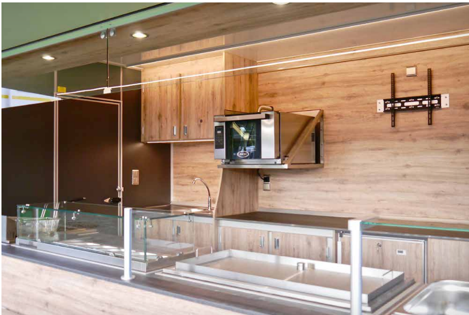
Backofen und Fernseher-Vorbereitung