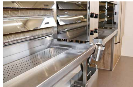
Hähnchenscherenbehälter zwischen den Grills