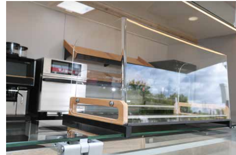
Zusätzliches Präsentationsregal auf der Theke

Die hier gezeigten Ausstattungsvarianten stehen exemplarisch für unsere große Auswahl. Sie wollen mehr erfahren oder haben eigene Vorstellungen? Ihr persönlicher Kundenberater hilft Ihnen gern weiter!