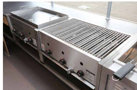
Griddlebräter und Rostbratgerät