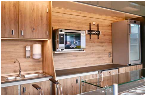
Getränkekühlschrank mit Glastür