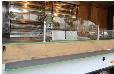
Variable Dekor- und Farbkombinationen

Darüber hinaus bieten wir Ihnen für folgende Ausstattungsbereiche individuelle Gestaltungsmöglichkeiten: