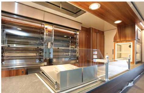
Abgestimmtes LED Imbiss Beleuchtungskonzept