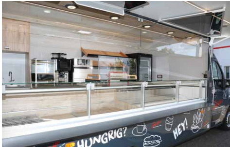
In der Verkaufsklappe integriertes LED-Lichtband