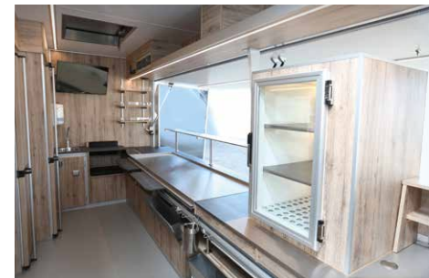
Salatkühlschrank auf Arbeitsfläche