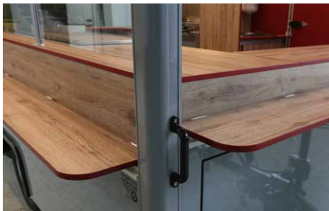
Vielfältige Flächen- und Kantendekore