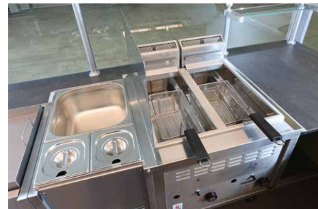
Doppelfritteuse mit Bain-Marie