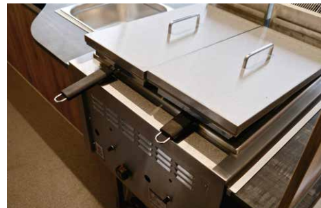
Edelstahl-Deckel für Fritteuse