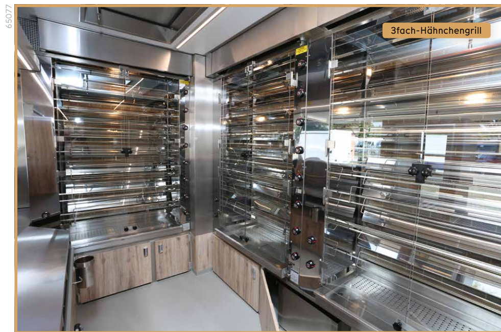
3 UBERT Grillgeräte in L-Anordnung