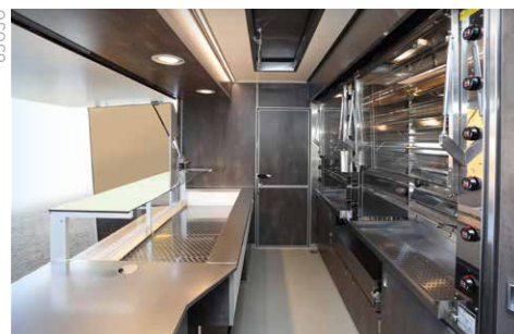
Kühltheke für zusätzliche Produkte