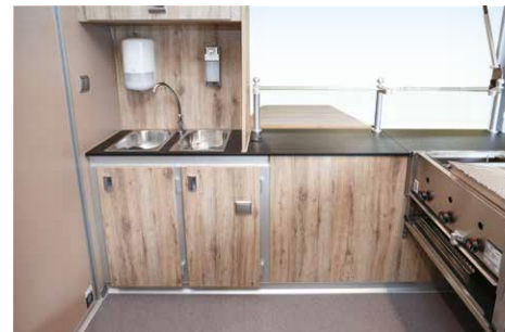
Hygienepaket nach DIN 10500