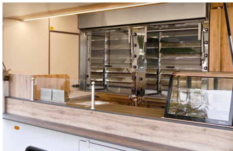
UBERT RT 66 DUO Infrarot-Grillgerät