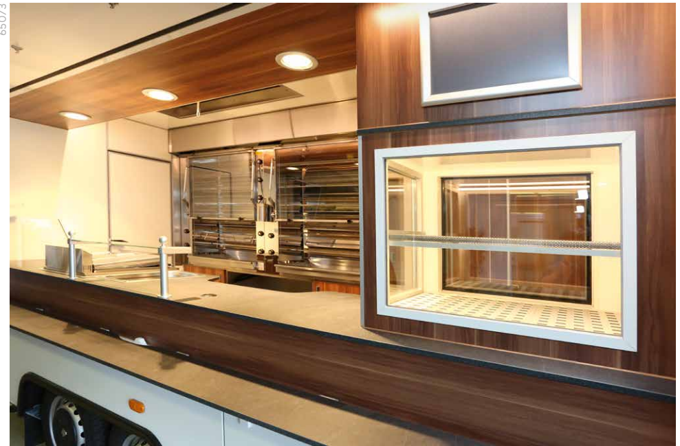
LED Food Beleuchtungskonzept