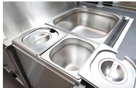
Bain-Marie mit variabler Anzahl an GN-Behältern