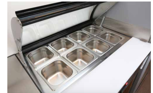
Gekühlte GN-Behälter im Kühlschrank