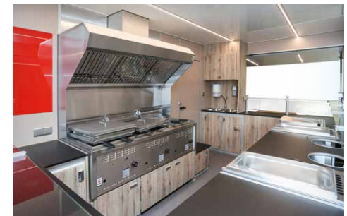
Zubereitungsbratstation mit Dunstabzugshaube