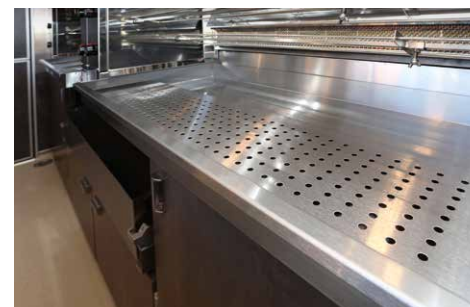
Arbeitsplatz am Grill