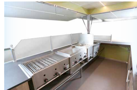
Brenner mit unterschiedlichen Heizzonenbereichen