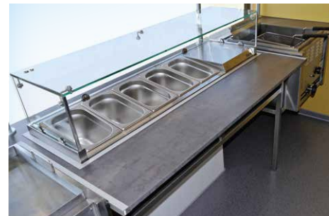
Saladette mit Spuckschutz