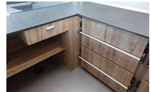
Kühlauszüge unter der Arbeitsfläche