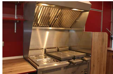
Snackstation mit integrierter Dunstabzugshaube