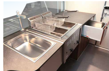
Doppelfritteuse, Salzbecken und Pommesbecken