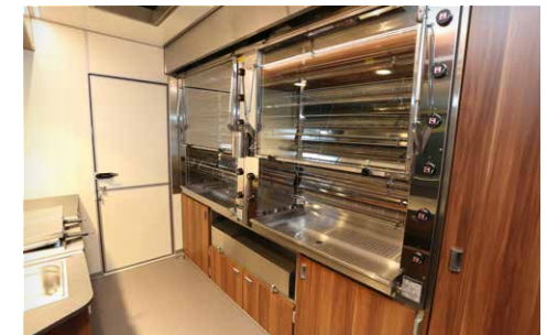
UBERT RT 66 DUO Infrarot-Grillgerät