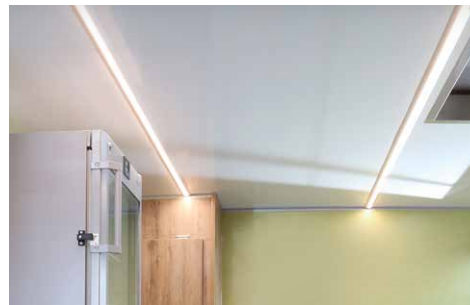
In der Decke integrierte LED-Lichtbänder