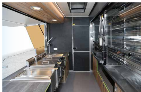
Tiefer Arbeitsbereich im Gang